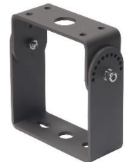
012595 Uchwyt do lampy Jiabin, Labid II