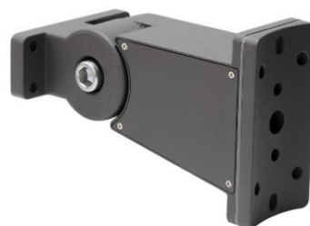
012596 Uchwyt do lampy Jiabin, Labid III