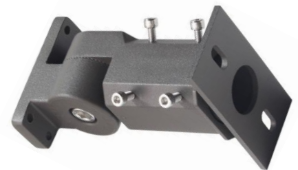
012597 Uchwyt do lampy Jiabin, Labid IV