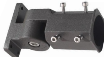
012594 Uchwyt do lampy Jiabin, Labid I