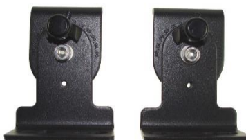
012155 Uchwyt regulowany