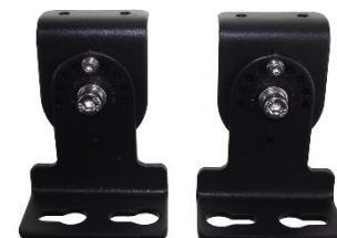
012156 Uchwyt regulowany