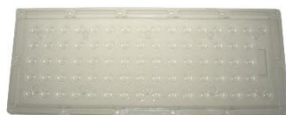
011810 Soczewk Lens 80°